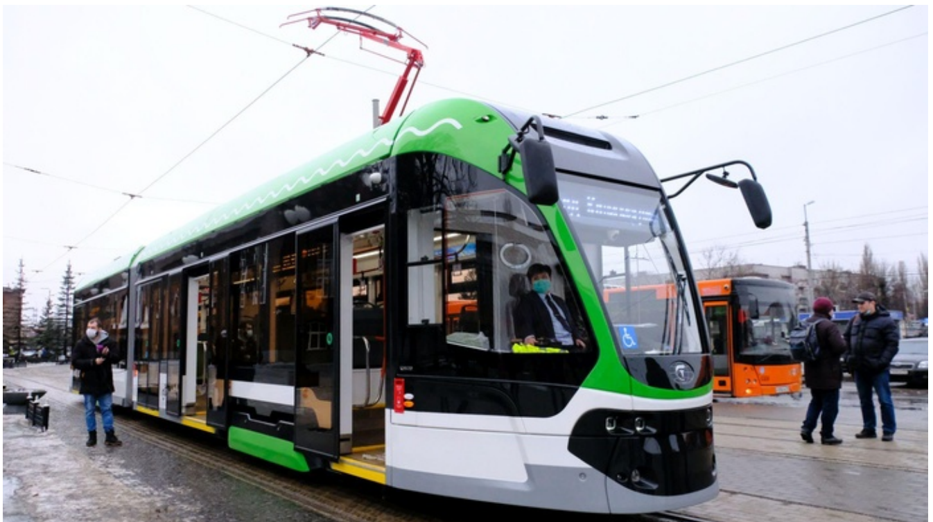
Трамвайный вагон 71-921 «Корсар». Автор: Яковец Виктория, ООО «ПК Транспортные системы», Москва.